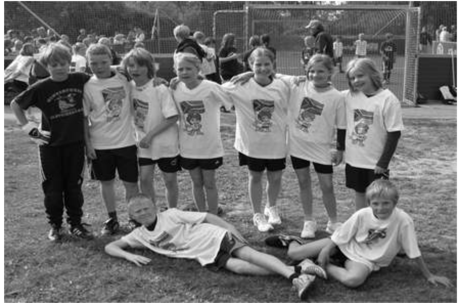
Mini-Spielfeld - 'ne tolle Sache!

Hennstedt (rd) – Auch Hennstedt hat jetzt eins – und zwar eines der vom DFB gesponsorten Mini-Spielfelder. Die Hennstedter Schule konnte – mit Unterstützung von Amt, Gemeinde und der SSV - die vom DFB geforderten Kriterien erfüllen, es wurde mit vielen Helfern und Firmen gearbeitet – jetzt war Eröffnung.